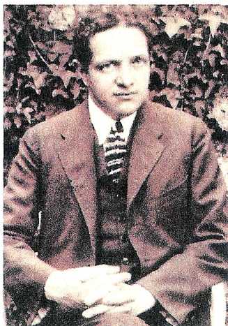
Der junge Dr. Jacob Levy Moreno während seiner Vöslau-Zeit.